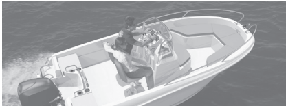
Cap Camarat 4.7 CC